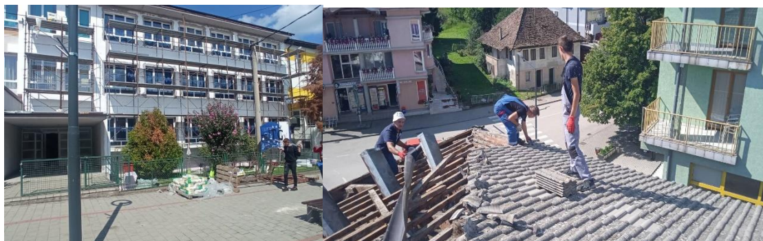
Termoizolacija zidova OŠ Čelić Sanacija krova OŠ Čelić

Većina škola i dalje se suočava s problemima loše opremljenosti kabineta za biologiju, hemiju, matematiku, informatiku i fiziku i sa određenim infrastrukturnim problemima. OŠ „Humci“ je za školsku 2022/23. godinu identifikovala nekoliko infrastrukturnih prioriteta: zamjena parketa u fiskulturnim salama u Humcima i Šibošnici kao i zamjena asfaltne podloge na sportskim poligonima, sanacija elektrovodova u kotlovnica u školama te sanacija ravnog krova u PŠ u Šibošnici. U OŠ „Čelić“ neophodno je izvršiti zamjenu podova i dotrajale unutrašnje stolarije te zamjenu sanitarnih čvorova. Sanacije krova i utopljanje škole postavljanjem termoizolacije i prelazak na pelet (centralno grijanje) prioritene su infrastrukturne potrebe PŠ u Ratkovićima. Infrastrukturni prioriteti u OŠ „Vražići“ su: rekonstrukcija krova i stolarije, ređenje dodatnog sportskog dijela dvorišta ČŠ Vražići Biblioteke u svim osnovnim školama su oskudno opremljene, dok nijedna područna škola nema biblioteku, što učenicima, posebno onim iz ruralnih dijelova općine predstavlja veliki problem.