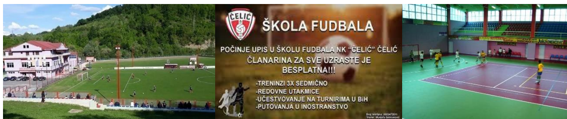
Fudbalski stadion u Čeliću

U sklopu privatnog Sportsko-rekreativnog centra „MM“ Mrkaljević nalazi se bazen dimenzija 40×20 m koji je idealan za gotovo sve uzraste a tu je i manji bazen za djecu kao i sportska dvorana sa svojih 1800 m 2 za skoro sve sportove : fudbal, kosarka, tenis, odbojka, rukomet.