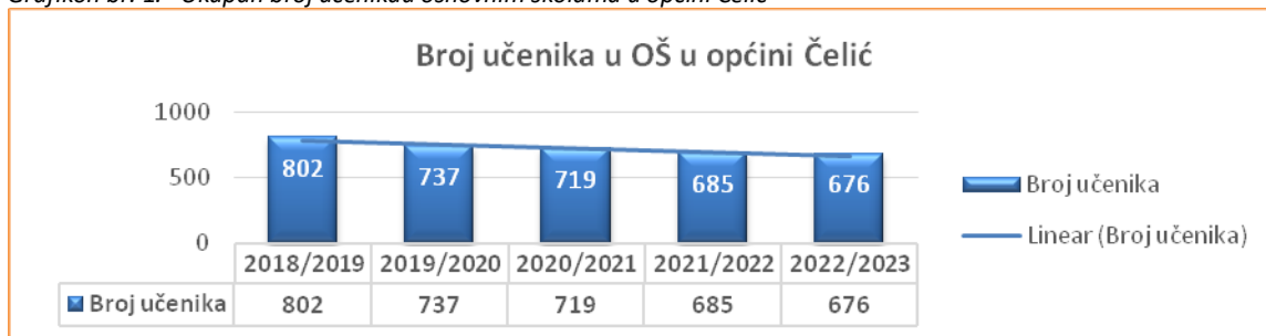
Grafikon br. 1. Ukupan broj učenika u osnovnim školama u općini Čelić

su većim dijelom slabog imovnog stanja i dolaze iz porodica u kojima su oba roditelja formalno nezaposlena.