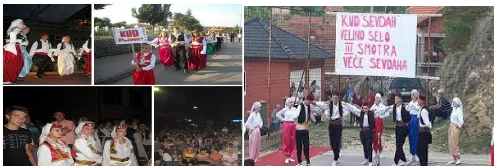
KUD „Mladost“ Čelić

Na području općine djeluju tri kulturno umjetnička društva, KUD „Mladost“ Čelići KUD Ratkovići i KUD „Sevdah“ Velino selo. KUD „Mladost“ Čelić ima mlađu i stariju folklornu sekciju dok u KUD „Sevdah“ Velino Selo djeluje mlađa i starija folklorna sekcija.